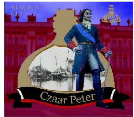
Czaar Peter cuvée 2003

Vorig jaar werd het Czaar Peter op een bijzondere, maar toepasselijke plek geïntroduceerd: de Ambassade van Russische Federatie in Den Haag. Voor het eerst konden we toen kennismaken met de